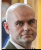
brig. gen. Miroslav FEIX

Velitel, Velitelství kybernetických sil a informační podpory, Armáda České republiky